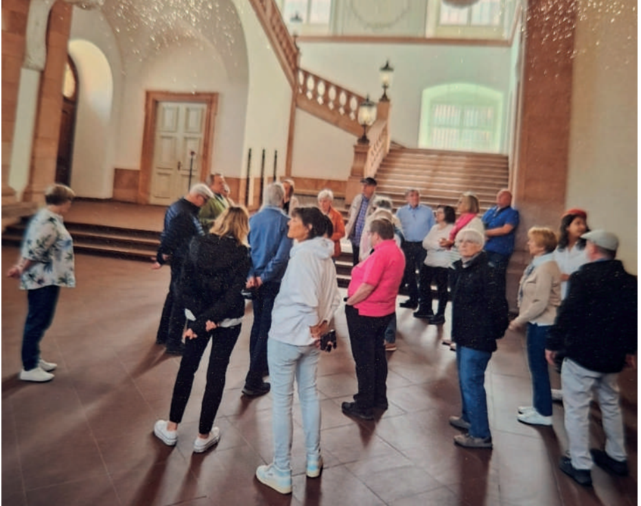
Besichtigung Barockschloss in Mannheim