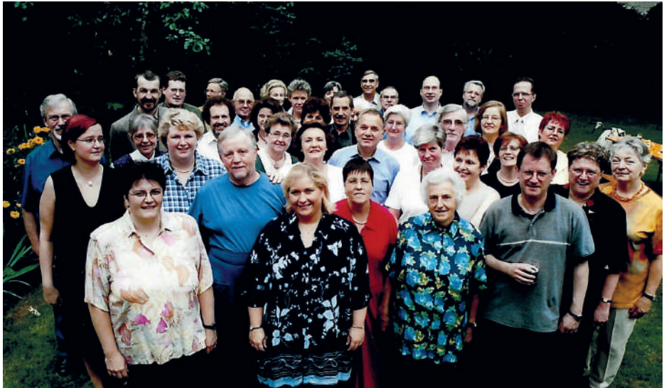
Stiftschor St. Lambertus vor 25 Jahren

Der Stiftschor der Basilika St. Lambertus feiert im Jahr 2026 sein 150jähriges Bestehen. Ein langer Zeitraum, in dem viel geschah.