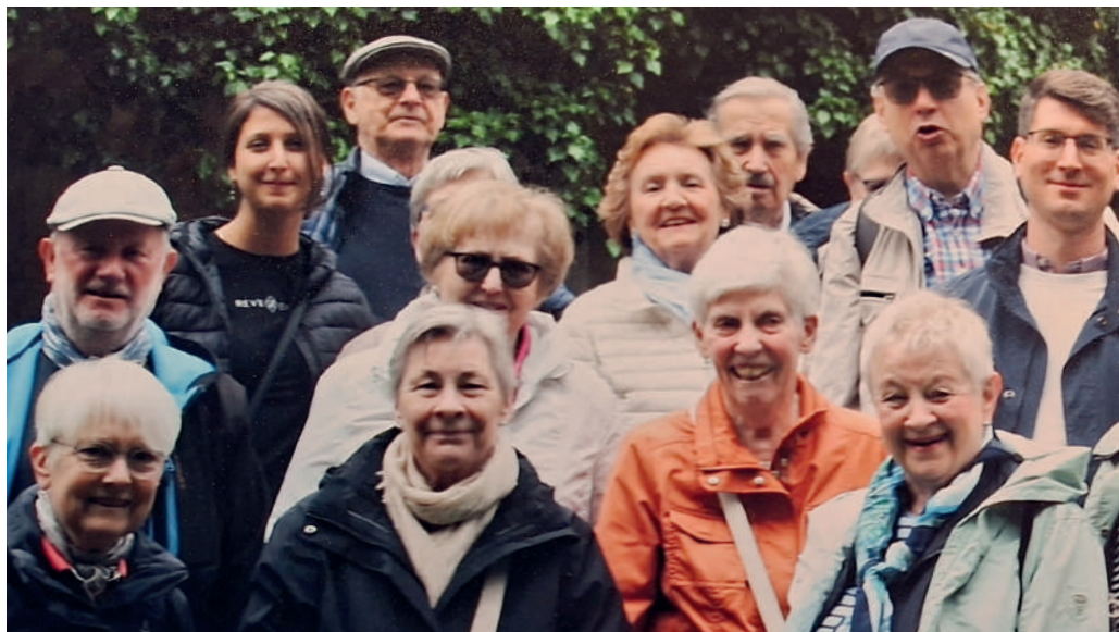
Stiftschor in Speyer auf dem Weg zum Dom. Mai 2025

Die Jungen und Mädchen des Kinderchores fuhren auch mehrfach