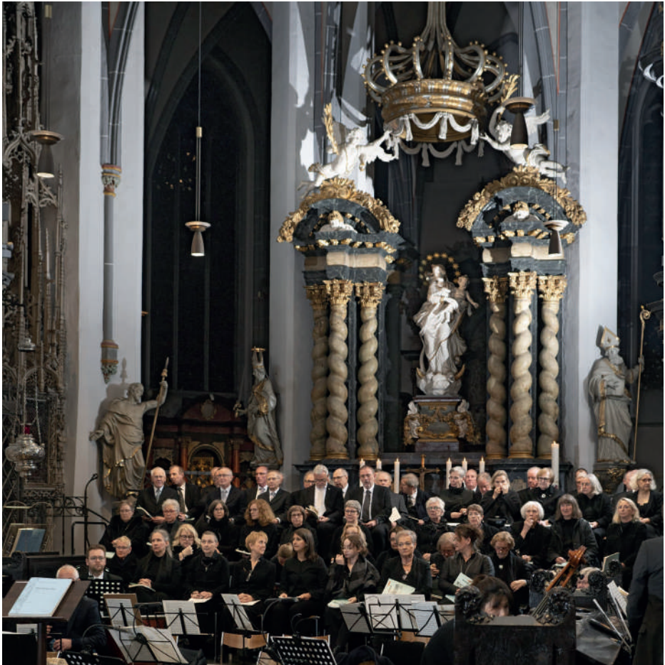
Stiftschor St. Lambertus mit dem Kirchenchor von St. Remigius 01.11.2024 Aufführung "Paulus" Viersen