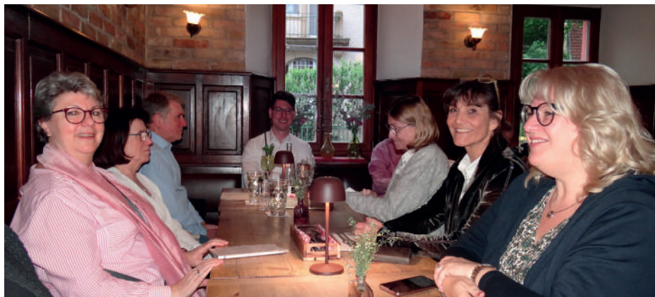
Das ist das letzte gemeinsame Abendessen in Mannheim Mai 2025